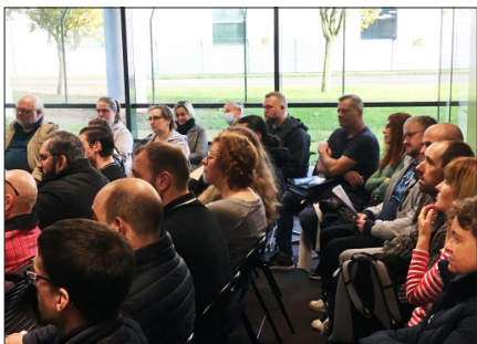
Edition 2022, Les Grands Chais de France