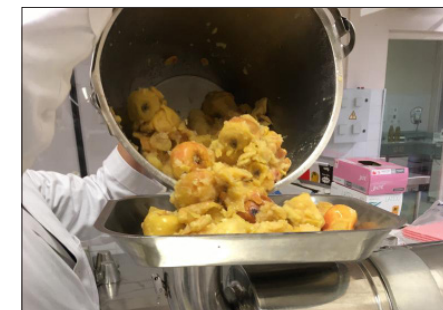
Edition 2022, EPL 54

ensuite pour adapter une action à vos besoins.