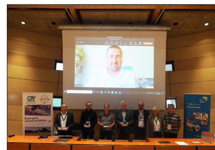
Lauréats INOVANA, édition 2022

Ne manquez pas cette occasion unique de célébrer l'innovation et d'encourager les esprits